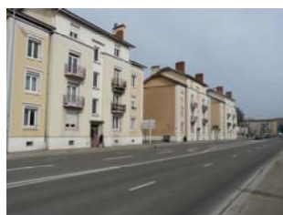
Quartier Lévrier à Bourg-en-Bresse