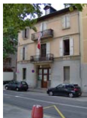
8, rue du Bâtonnet et 171 rue Michaud à Chambéry