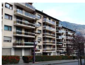
Le Beausoleil à St-Jean-de-Maurienne