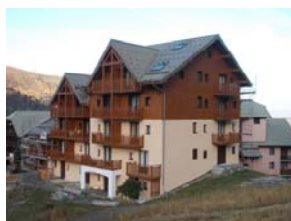
Avenir II à Valmeinier