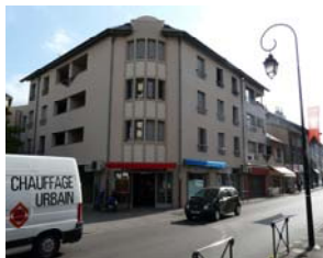
Le Peney 2, fbg Montmélian à Chambéry