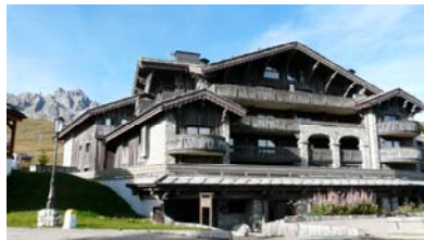
Les Balcons de Pralong à Courchevel 1850