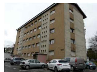
Les Curtines à La Rochette