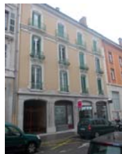
4, rue du GI Ferrié à Chambéry