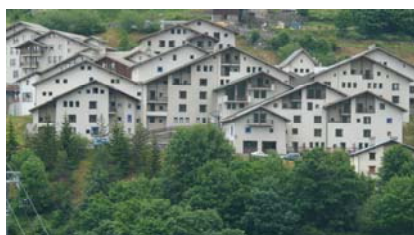
Bâtiments Renouveau à Valmeinier