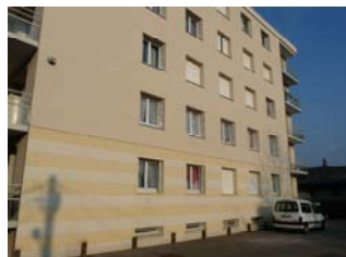
Le Feu Vert à Cognin