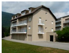
Résidence En Vallière à Gex