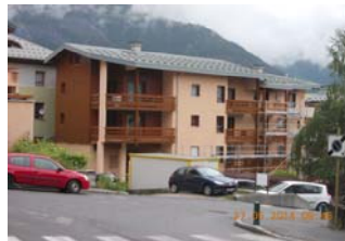
Le Plein Ciel à Bourg Saint-Maurice