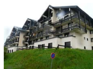
Le Bisanne aux Saisies