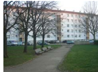
Résidence 304 à 314, boulevard Pinel à Lyon